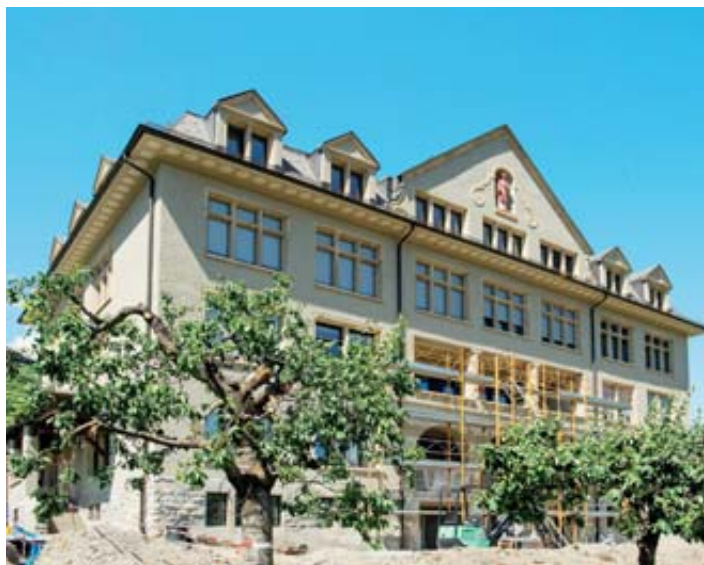
Hier, les ouvriers terminaient les derniers travaux de la maison qui était l'ancien couvent des sœurs hospitalières. SACHA BITTEL

La cuisine, aménagée au rez-de-chaussée, est aussi un élément important de l'habita-